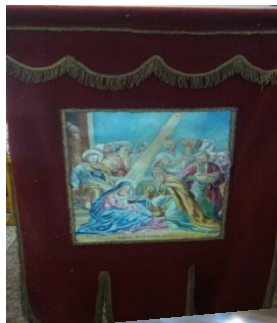
Maľba Pavla Ondiča na zástave, ktorú darovala Mária Ondičová, matka Pavla Ondiča.