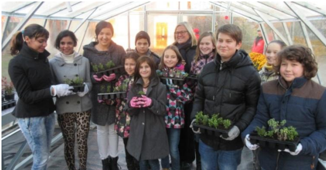
Fotografie z návštevy z Nórskeho veľvyslanectva