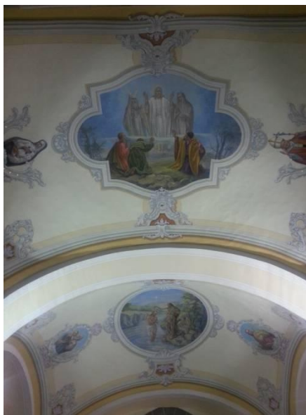
Nové maľby na klenbách kostola Najsvätejšej Trojice v Budkovciach, foto: M. Pristaš