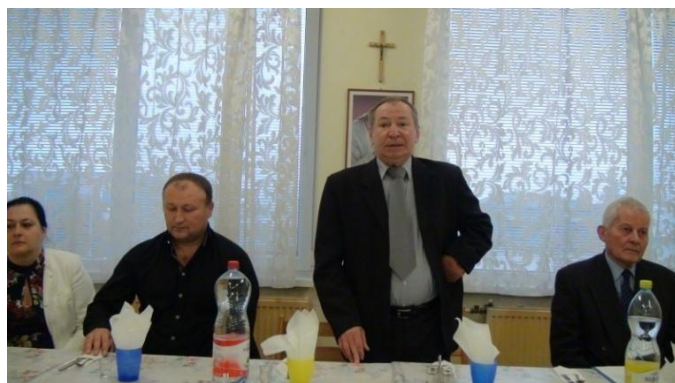
Členovia Klubu dôchodcov Budkovce na posedení z príležitosti Mesiaca úcty k starším .