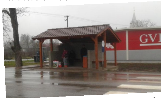
Zrekonštruovaná autobusová zastávka „Zelenina“