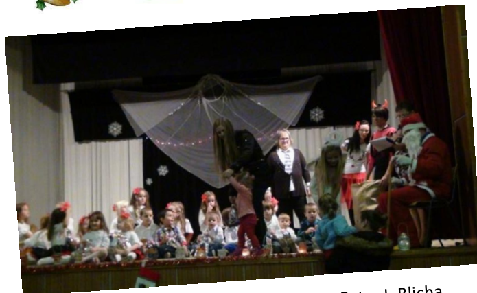
Mikuláš na OcÚ Budkovce, 5.12.2015.