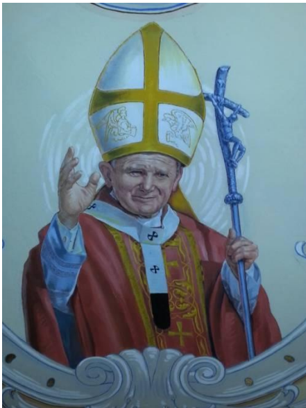
Svätec Ján Pavol II