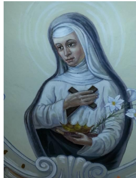
Svätá Margita Uhorská, foto M. Pristaš