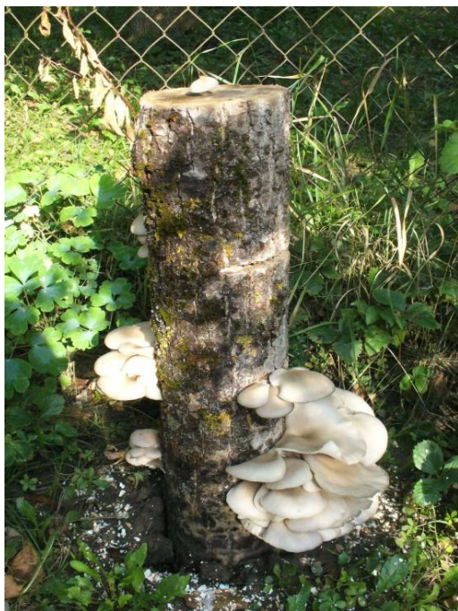
Hliva ustricovitá (majiteľ Š. Šimko), foto: M. Pivarník