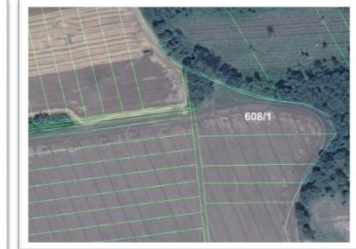
Miesto núdzového pristátia v k.ú. Hatalov