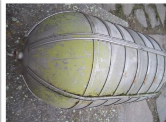
Jedna z desiatich kyslíkových fliaš z lietadla B-17