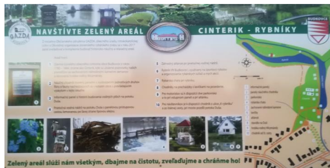
Pozývaci infopanel na budove Obecného úradu Budkovce