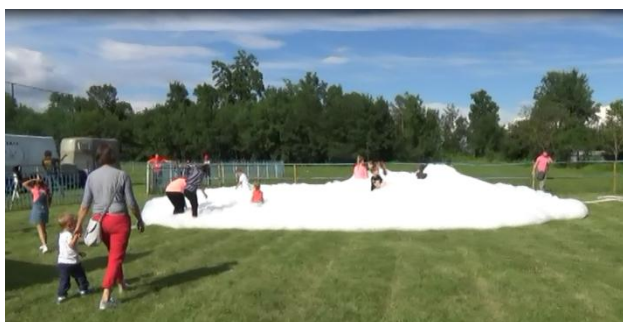
Hasičská pena, foto: J. Bliha