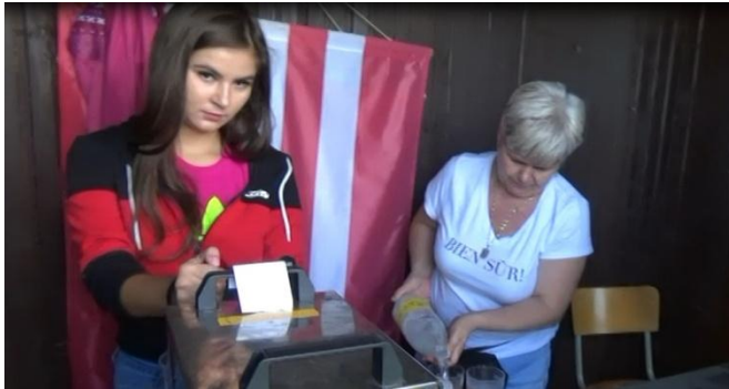
Neodmysliteľný bufet