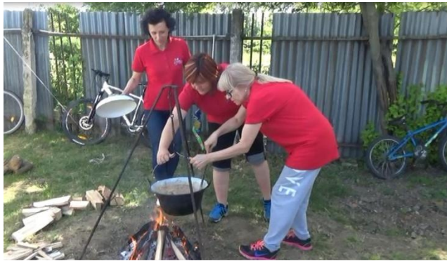
Družstvo ZŠ J. Bilčíkovej