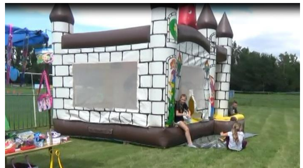
Hrad na skákanie