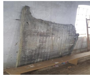
Trosky z lietadla B-17 v depozite obce Hatalov