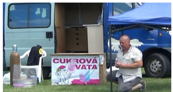
Cukrová vata