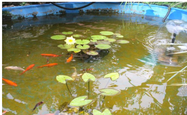
Lekno biele