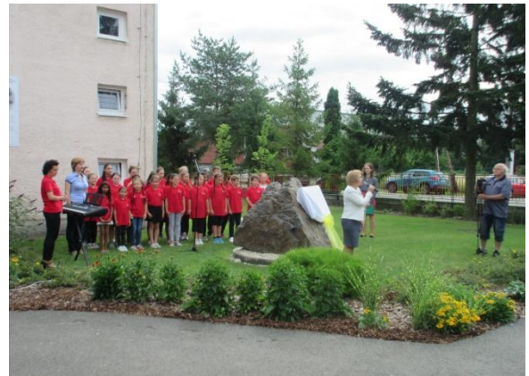
Odhalenie pamätnej tabule