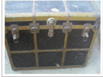
Všetky predmety sú pôvodné ( z roku 1928 - 29)