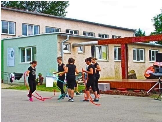
Práca s drevom