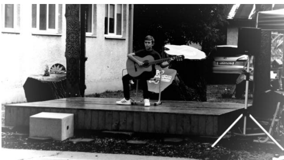
Vystúpenie S. Bajuzíka