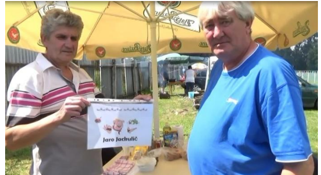
Družstvo Š. Nadzama