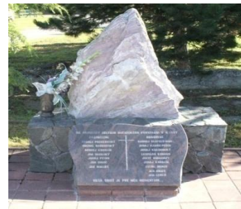
Pamätník obetiam povstania, foto: M. Pivarník