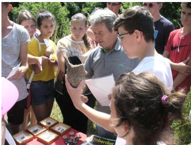
Žiaci Základnej školy J. Bilčíkovej Budkovce na exkurzii s členmi OZ Gazda – Budkovce, foto : A. Sabolová