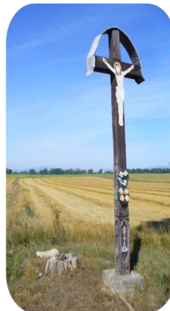
Prícestný drevený kríž rodiny Kišíkovej