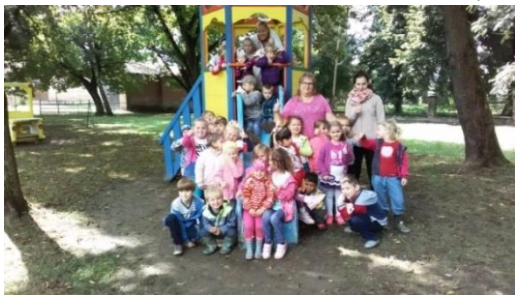
Prvé spoločné tohtoročné foto