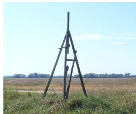
Miesto, kde stáli šibenice, foto: M. Pivarník.