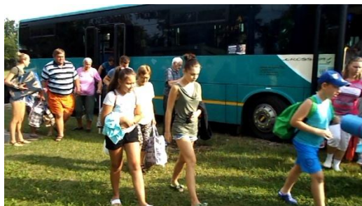
Účastníci výletu.