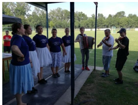
Folklorná skupina Dreňích na Dňoch obce 2017.