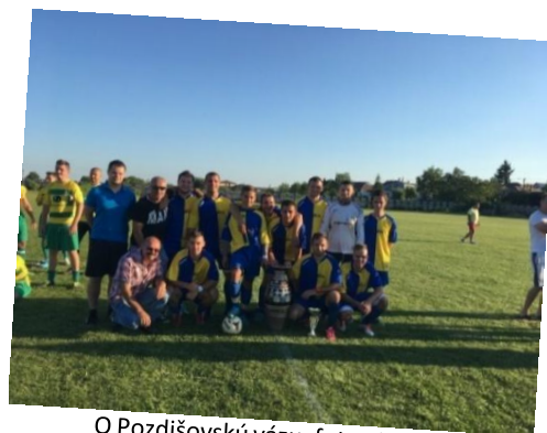
O Pozdišovskú vázu