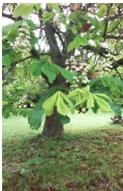
Takto nás privítal gaštan