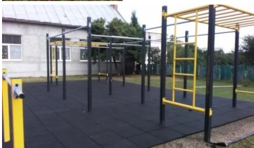
Už si tu môžete zacvičiť