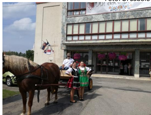
Vozenie na koči v obci – reklama na Folklorne slávnosti