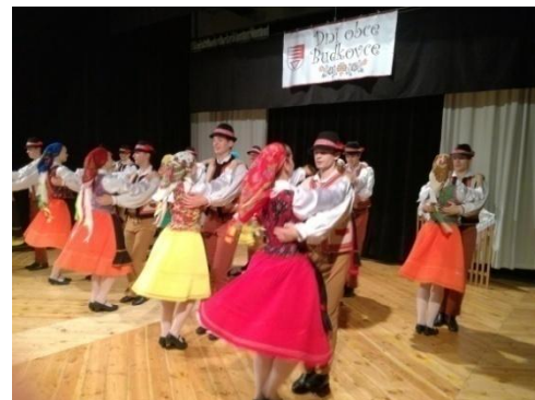
Najvzácnejší hosť – Folklorný súbor Zemplín.