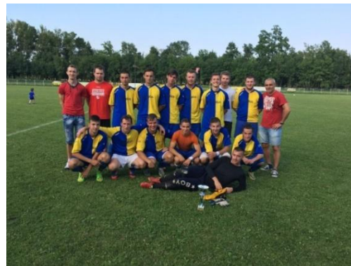
Derby cup, foto: L. Ložanský